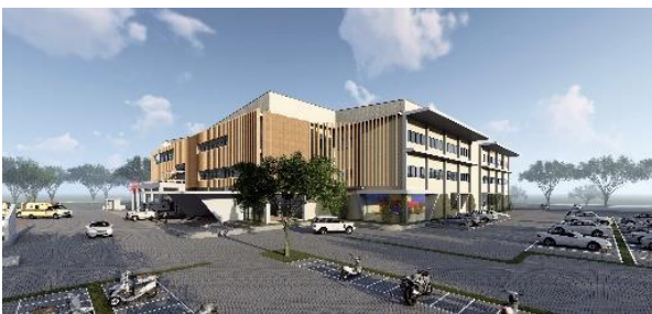
Gambar 4. Pintu Masuk Utama

Pada arah tenggara yang merupakan pintu masuk utama dilakukan permainan potongan dan penambahan agar massa lebih menarik.