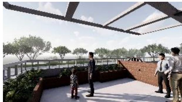
Gambar 5. Roof Garden

Taman tersebut juga terdapat pada atap sebagai ruang bersama pengunjung.