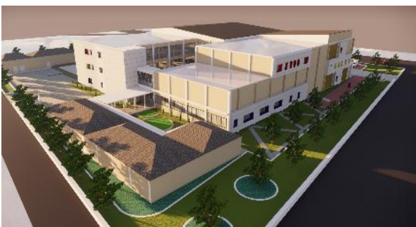
Gambar 5. Pintu Masuk Samping

Pada arah muka yang berada pada jalan utama dilakukan pula permainan kisi-kisi untuk lebih atraktif dan sebagaiantisipasi terhadap cuaca.