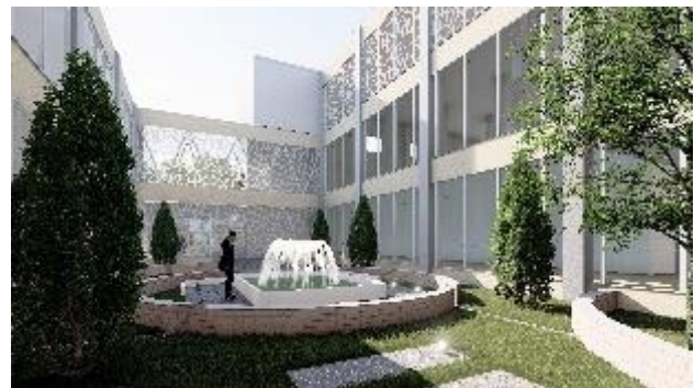
Gambar 4. Healing Garden

Penerapan konsep healing environment diwujudkan dalam aspek alam, panca indra dan psikologis. Ruang-ruang rawat dan instalasi rumah sakit lainnya memiliki taman-taman dan ruang terbuka yang terintegrasi dengan memanfaatkan sebanyak mungkin pencahayaan alami.