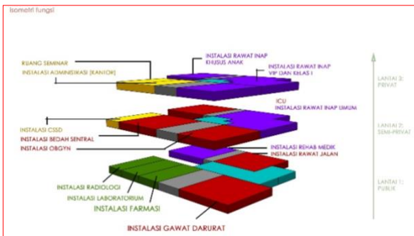
Gambar 3. Zonasi

Zonasi RSIA Bogor dilakukan menurut pelayanan medik yang diberikan yaitu publik, medik, rawat, penunjang medik, penunjang non medik dan servis.