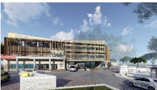
Gambar 5. Pandangan dari Arah Depan

Pada arah muka yang berada pada jalan utama dilakukan pula permainan kisi-kisi untuk lebih atraktif dan sebagaiantisipasi terhadap cuaca.