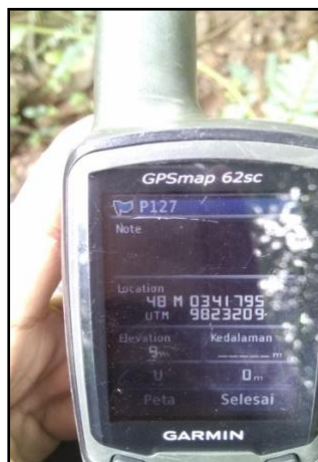
Gambar 1. GPS Garmin

Analisis data dilakukan dengan metode deskriptif kualitatif. Data yang didapat yaitu data sumber pencemar divalidasi dengan data yang ada di lapangan, kemudian posisi titik sumber pencemar direkam menggunakan Global Position System (GPS) merk Garmin. Penandaan titik sumber pencemar dilakukan selama 3 hari.