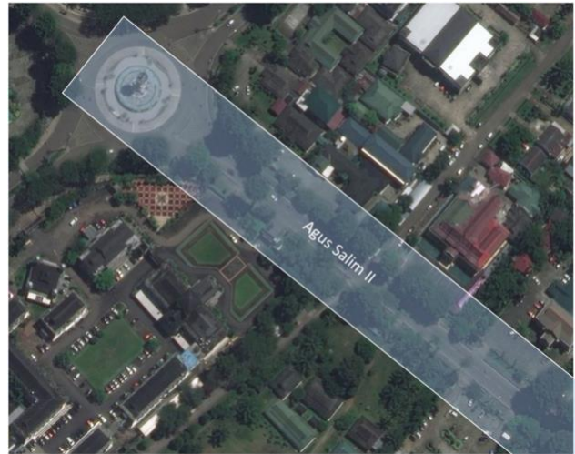
Gambar 5. Penggal Jl. Agus Salim II

Keberadaan Pedagang Kaki Lima (PKL) pada sistem seting Kawasan Tugu Keris dapat dijelaskan dengan teori perilaku. Perilaku PKL di sistem seting Kawasan Tugu Keris merupakan respon dari stimulus baik stimulus eksternal dan internal. Ruang yang tercipta di di jalan ataupun jalur pejalan kaki lima telah dimanfaatkan oleh masyarakat untuk melakukan aktivitas pribadinya. Fungsi dari ruang tersebut pada mulanya adalah ruang publik bagi jalan dan jalur pejalan kaki, namun selanjutnya ramai oleh aktivitas PKL yang mengakibatkan lingkungan sekitar menjadi kurang tertib.