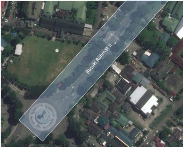
Gambar 3. Penggal Jl. Basuki Rahmat II

Kawasan amatan terdiri dari rotunda Tugu Keris dan bulevar yang memusat ke Tugu Keris. Pada rotunda Tugu Keris didominasi oleh Pedagang Kaki Lima penjual makanan ringan hingga besar serta pangkalan kereta untuk berkeliling kawasan. Pada ruas jalan Basuki Rahmat I (Gambar 2) didominasi oleh penjaja makanan gerobak atau jinjing hingga pertengahan ruas jalan. Pada ruas jalan Basuki Rahmat II (Gambar 3) menjadi lahan parkir kendaraan roda empat. Pada ruas jalan Agus Salim I (Gambar 4) tidak terlalu padat dengan penjaja makanan gerobak namun lebih didominasi oleh penjaja yang berjualan menggunakan kendaraan roda empat. Ruas ini selain penjaja makanan juga lebih bervariasi seperti busana sedangkan makanan telah mendapat relokasi yang juga terletak pada salah satu jalan cabang di Agus Salim I ini. Untuk ruas jalan Agus Salim II (Gambar 5) terutama didominasi oleh permainan.