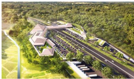
Gambar 1. Rest Area KM 456 Salatiga

Rest area Pendopo 456 Salatiga, sebuah rest area yang berada di KM 456 tol Semarang- Solo, Jawa Tengah. Rest Area ini terbilang unik karena terdapat jembatan penghubung antara jalur A dan jalur B. Di tol Trans Jawa, Resto Pendopo 456 diklaim menjadi rest area termegah yang terletak tidak jauh dari exit tol Salatiga. Rest area tipe A ini dirancang berbeda destinasi ruang kuliner, ruang ritel, ruang atraksi budaya, area terbuka hijau, area bermain dengan layaknya konsep yang sebuah dilengkapi.