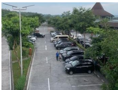
Gambar 2. Area Parkir Rest Area KM 456 Salatiga

Rest area km 456 menyediakan fasilitas yang lengkap. terdapat minimarket, kios jajanan, masjid dengan kapasitas 300 jamaah, musholla dengan kapasitas 100 jamaah, mesin ATM, stasiun pengisian bahan bakar umum, toilet umum yang bersih, area terbuka hijau, dan masih banyak lagi. rest area km 456 juga memiliki area parkir yang luas yaitu area parkir kendaraan roda 4 sebanyak 77 lot di Resto A dan 130 lot di Resto B, serta total 40 lot parkir untuk bus dan truk.