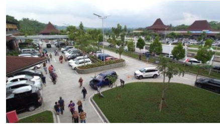
Gambar 3. Vegetasi Rest Area KM 456 Salatiga

mendapat respon pencahayaan dan penghawaan yang cukup bagus.