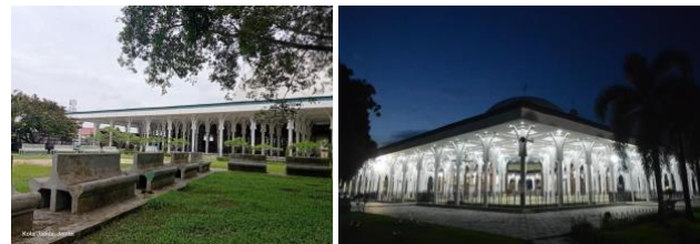
Gambar 2. Masjid Agung Al-Falah