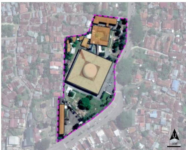
Gambar 1. Tapak Eksisting Masjid Agung Al-Falah

Masjid Agung Al-falah Jambi merupakan salah satu masjid terbesar di Provinsi Jambi, yang lebih dikenal dengan masjid 1.000 (seribu) tiang. Masjid ini dibangun pada tahun 1971 dan selesai pada tahun 1980. Bangunan masjid ini memang hanya seperti sebuah pendopo terbuka dengan banyak tiang penyangga dan satu kubah besar di atasnya. Bentuk bangunan dengan konsep keterbukaan tanpa sekat seperti ini menghasilkan konsep ramah. Masjid kebanggaan warga Jambi ini berdiri di atas lahan seluas lebih dari 26.890 M 2 atau lebih dari 2,7 Hektar, sedangkan luas bangunan masjid adalah 6.400 M 2 dengan ukuran 80m x 80m, dan mampu menampung 10 ribu jamaah sekaligus. Sedari awal bangunan Masjid Agung hingga sekarang tetap dipertahankan sesuai bentuk awalnya.