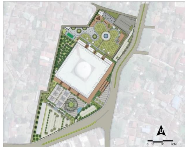
Gambar 1. Tapak Rencana Masjid Agung Al-Falah

Dalam desain perlu dipahamai lingkup pemrograman dan kedudukan pemrograman itu di dalam desain, sebelum masuk kedalam pemrograman, maka perlu diketahui pengertian ataupun pendapat beberapa pakar tentang pemrograman, diantaranya pemrograman merupakan bagian penting dari proses desain atau posisi pemrograman merupakan awal kegiatan atau system dari suatu proses perancangan arsitektur ( W.Moleski dan H.Sanof ). Selanjutnya juga Pemrograman adalah bagian desain, karena pemrograman merupakan kegiatan analisis dalam kaitan upaya pemecahan masalah desain ( Mc.Laughlin ). Pemrograman merupakan bagian awal dari perancangan (Planning) dan produknya merupakan "informasi" sebagai input bagi kajian perkembangan masa yang akan datang. Disamping itu pemrograman selalu di alamatkan pada fakta-fakta, kondisi dan keputusan-keputusan (E.Agostini & E.T.White).