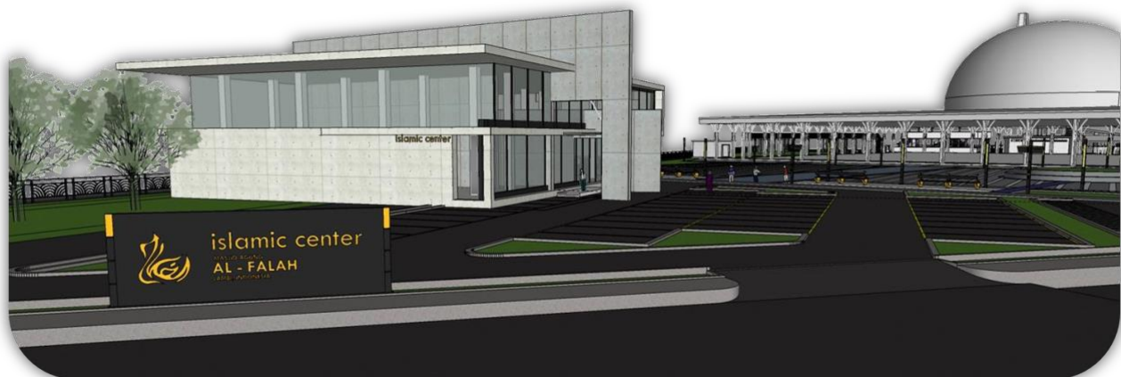
Gambar 3. Pintu Masuk Samping

Pada ruang terbuka ditambahkan ikon sebagai tetenger kawasan sekaligus sebagai point of interest.