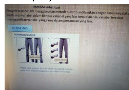
Gambar 4.8 Media powerpoint yang disajikan guru

penggunaan latar belakang powerpoint berwarna buram sehingga mengganggu siswa dalam mengamati materi pelajaran yang dijelaskan guru (seperti gambar 4.8). Artinya media pembelajaran yang digunakan guru tidak mampu menciptakan daya tarik bagi seluruh siswa sehingga membuat siswa lebih memperhatikan materi pelajaran yang berakibat pada banyak siswa yang tidak memahami materi pelajaran.