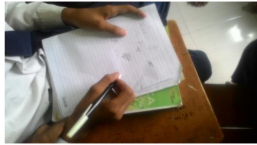
Gambar 4.6 Aktifitas Siswa dalam Proses Pembelajaran berlangsung.

Artinya guru tidak memulai pelajaran dengan terlebih dahulu memberikan stimulus berupa permasalahan dalam kehidupan sehari yang membuat tertantang untuk mencari solusi dari permasalahan tersebut. Oleh karena terlihat bahwa model pembelajaran berbasis masalah tidak dilakukan oleh guru. Begitu juga dalam menerapkan indikator model pembelajaran yang lainnya seharusnya siswa di stimulus agar dapat mengajukan berbagai pertanyaan untuk menjawab permasalahan dalam kehidupan sehari-hari tersebut tetapi ketika diberikan soal latihan untuk dikerjakan secara berkelompok, maka hanya sebagian kecil siswa yang berlatih atau melakukan eksperimen dalam menyelesaikan masalah yang diberikan guru sedangkan sebagian besar siswa menyibukkan dengan aktifitas masing-masing seperti menggambar, melihat temannya berlatih, bermain dengan temannya bahkan ada yang tertidur di dalam kelas. (seperti gambar 4.6)