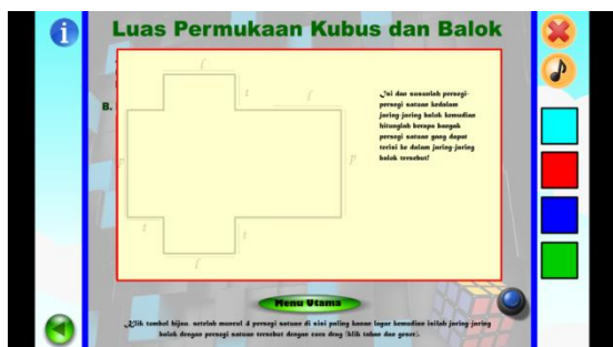
Gambar 3.6 Tampilan halaman simulasi menghitung luas permukaan balok setelah direvisi sesuai saran ahli materi