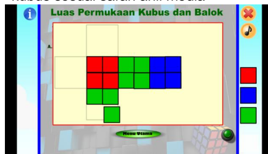
Gambar 3.1 Tampilan halaman simulasi menghitung luas permukaan kubus setelah direvisi sesuai saran ahli media