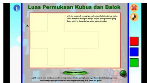
Gambar 3.5 Tampilan halaman simulasi menghitung luas permukaan kubus setelah direvisi sesuai saran ahli materi