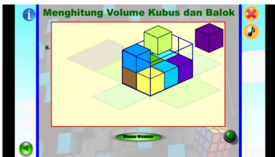
Gambar 3.4 Tampilan halaman simulasi menghitung volume balok setelah direvisi sesuai saran ahli media

Setelah media direvisi sesuai saran ahli media. Selanjutnya, penilaian materi terhadap media pembelajaran. Materi