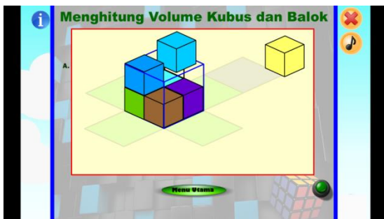
Gambar 3.3 Tampilan halaman simulasi menghitung volume kubus setelah direvisi sesuai saran ahli media