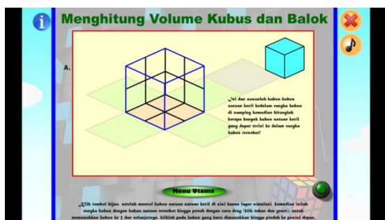
Gambar 3.7 Tampilan halaman simulasi menghitung volume kubus setelah direvisi sesuai saran ahli materi