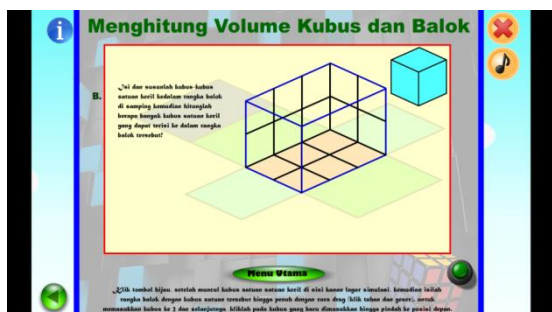
Gambar 3.8 Tampilan halaman simulasi menghitung volume balok setelah direvisi sesuai saran ahli materi

Selain menilai materi yang terdapat di dalam media pembelajaran, ahli materi