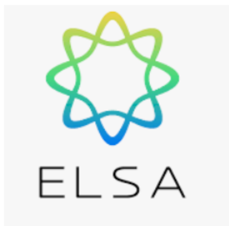
Gambar 1. Logo resmi ELSA Speak

Aplikasi ELSA Speak adalah alat pembelajaran bahasa Inggris yang fokus pada peningkatan kemampuan berbicara dan pengucapan. Aplikasi ini menggunakan teknologi kecerdasan buatan (AI) untuk menganalisis pengucapan pengguna dan memberikan umpan balik secara real-time (Kholis, 2021). Selain mampu membantu kemampuan lisan, Aplikasi ELSA Speak mampu memberikan Umpan Balik Real-Time, di mana ELSA memberikan umpan balik langsung tentang pengucapan, menunjukkan kesalahan spesifik, dan cara memperbaikinya. Berdasarkan kinerja, aplikasi ini menyesuaikan latihan untuk membantu memperbaiki kelemahan tertentu dalam pengucapan dan intonasi. Selain fokus pada pengucapan, ELSA Speak juga membantu pengguna dalam memperluas kosa kata dan belajar frasa-frasa yang umum digunakan. Aplikasi ini juga dapat memberikan penilaian mengenai tingkat kemampuan berbicara, sehingga pengguna bisa melacak perkembangan diri dari waktu ke waktu. Dengan demikian, ELSA Speak sangat berguna bagi siapa saja yang ingin meningkatkan kemampuan berbicara Bahasa Inggris, baik untuk keperluan profesional ataupun akademis (Anggraini, 2022).