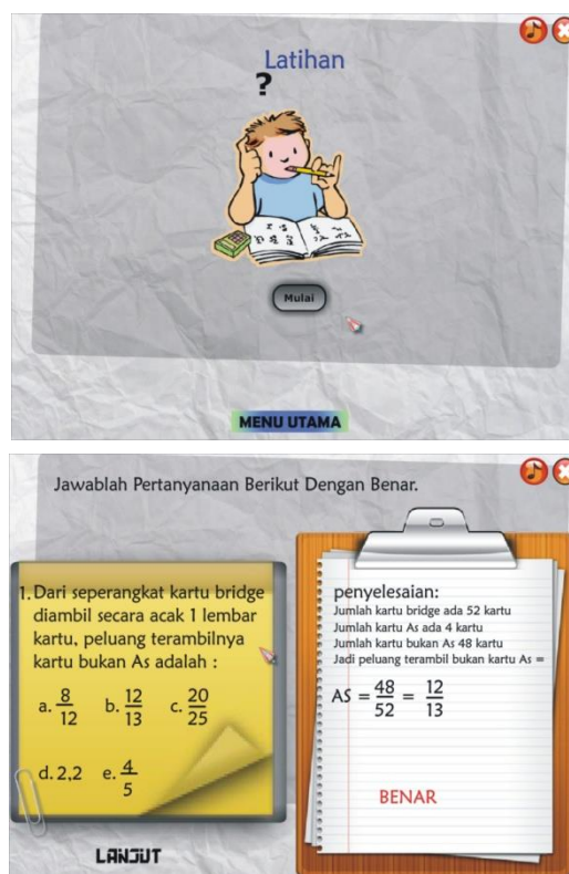
Gambar 2. Tampilan latihan

pemahaman siswa dengan materi yang sedang dipelajari. Tampilan latihan dapat dilihat pada gambar 2.